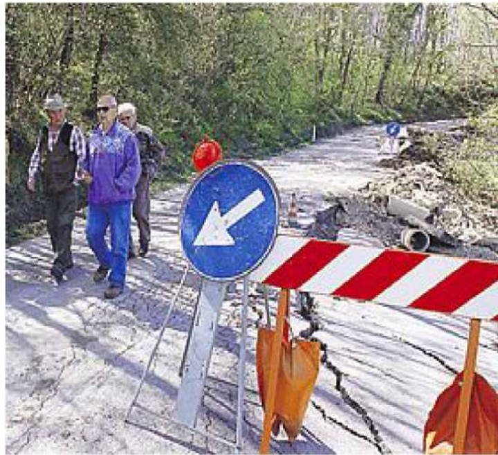
PRIORITA' Una delle tante frane che hanno colpito il territorio