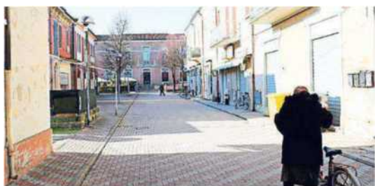
La piazza di Formignana e la sede del bar Arci