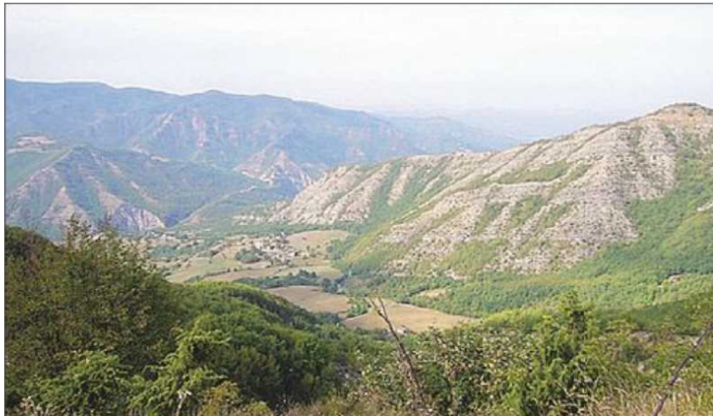
Una veduta della vallata del Santerno che comprende i tre Comuni interessati alla fusione